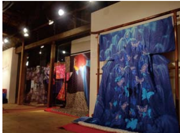
© 2007 蜷川組「さくらん」フィルム・コミッティ © 安野モヨコ / 講談社 photo by mika ninagawa

蜷川実花写真館では、現在、蜷川実花による初監督映画「さくらん」において使用された衣装を、蜷川組「さくらん」フィルム・コミッティ様のご好意により、一部展示公開を行っています。展示テーマを変え、第5回目となる今回は、「衣装で楽しむ蜷川作品」をテーマに、蜷川実花の写真作品を使用した衣装をご紹介します。土屋アンナさんが演じる主人公“きよ葉””日暮”、菅野美穂さんが演じる“粧ひ”の豪華絢爛な衣装たち……。蜷川監督、スタイリストの伊賀大介さん・杉山優子さんのディレクションのもと、京都のデザイナーや職人が一点一点技術を駆使することで、艶やかに生まれた変わった蜷川作品の数々を、どうか心ゆくまでご堪能いただければ幸いです。また、今後も季節やテーマに合わせて衣装の展示替えを行っていきますので、どうぞご期待ください。（元の写真作品や掲載写真集の詳細は、当店 HP でご紹介しています。www.kyobase.com よりアクセスください）