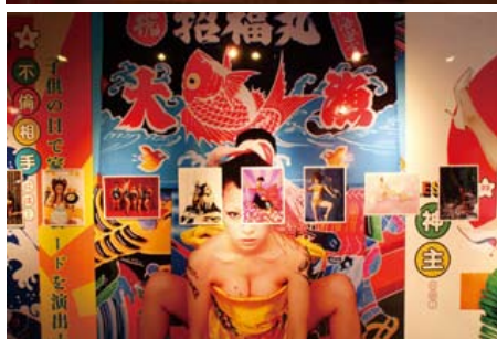
左上：第1回写真展 「Secret Flowers」 左下：第2回写真展 「EROTIC TEACHER XXX YUCA」 右上：第3回写真展 「UMEZZ HOUSE」